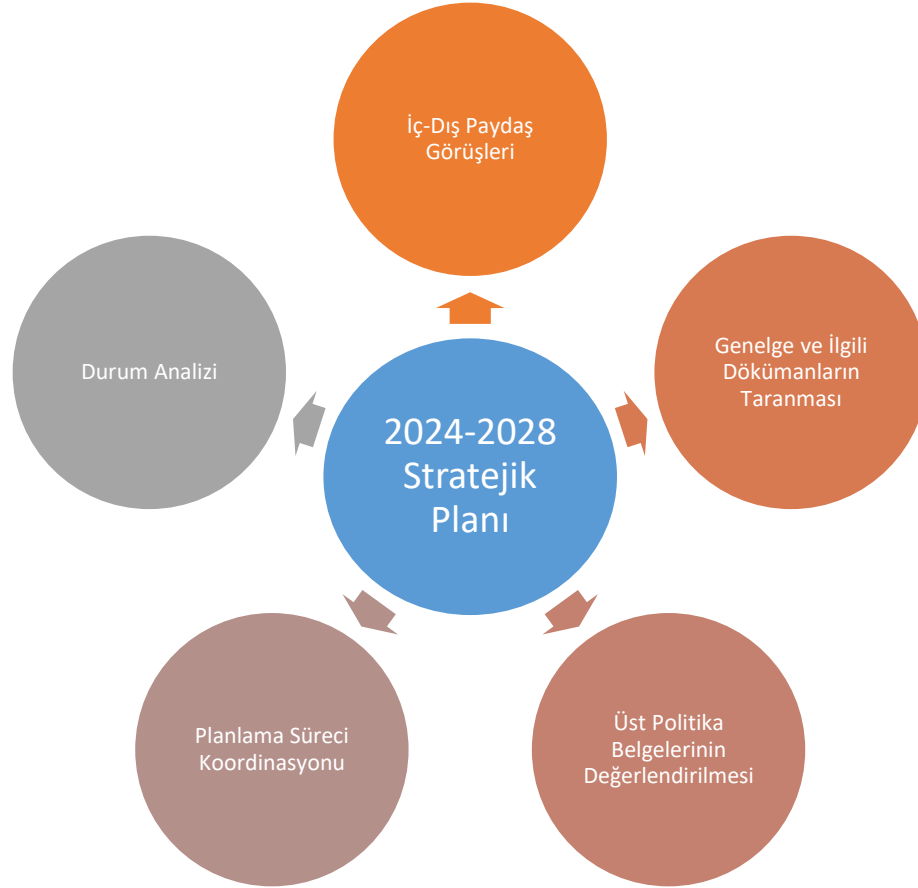
Şekil 1. Plan Oluşum şeması